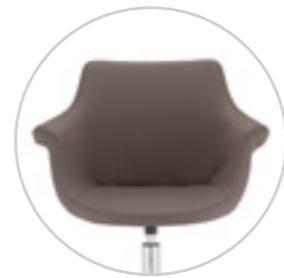
Fully upholstered seat and backrest