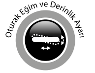
S-Line 6+ MFA