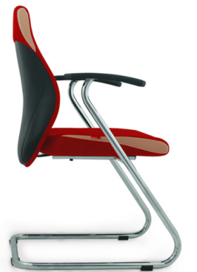
Trevo 3 A