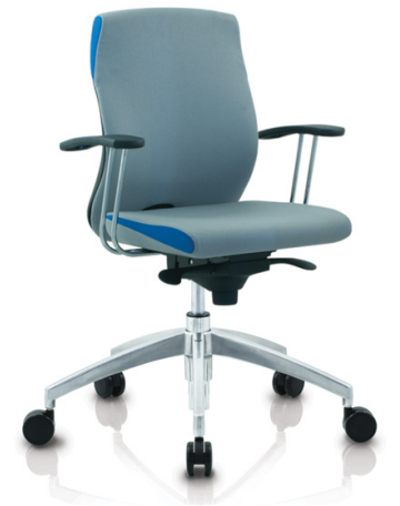
Trevo 5 A