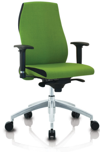
Trevo 7 MFA