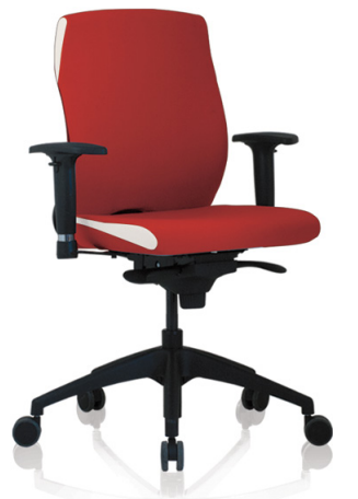
Trevo 4 MFA