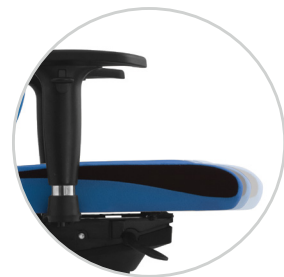
Seat depth adjustment