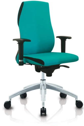
Trevo 6 MFA