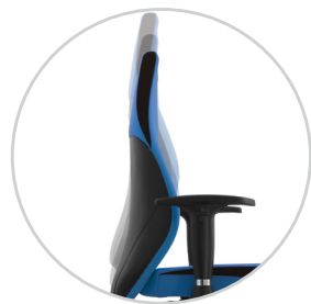
Backrest height adjustment with (EasiLift)