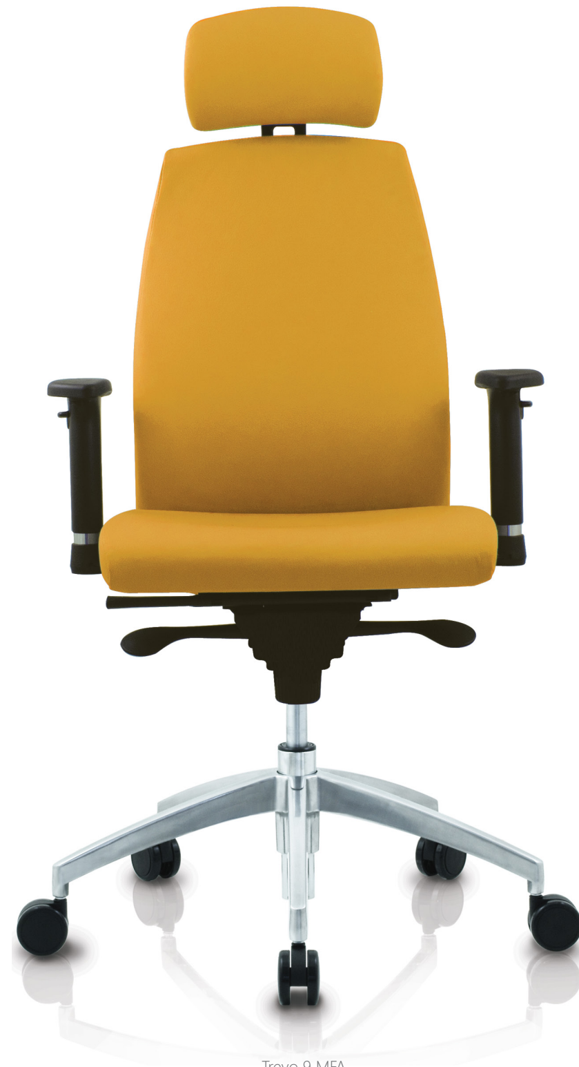
Trevo 9 MFA