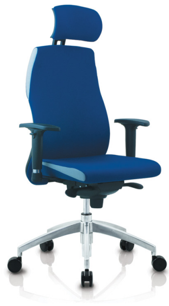
Trevo 8 MFA