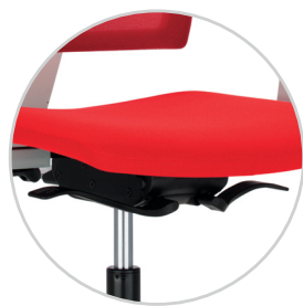
Various mechanism options