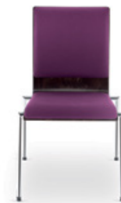
Cadeira S 30