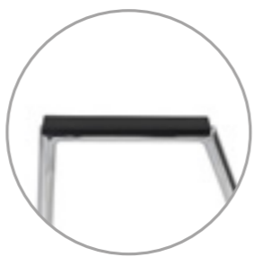
Armrests with plastic pads