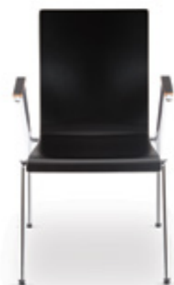
Cadeira SA 10