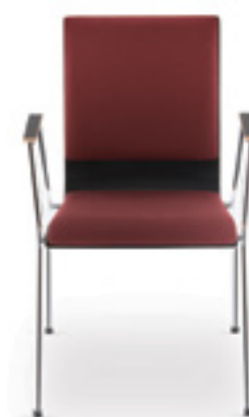
Cadeira HA 30