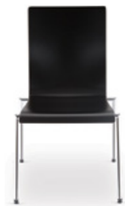
Cadeira S 10