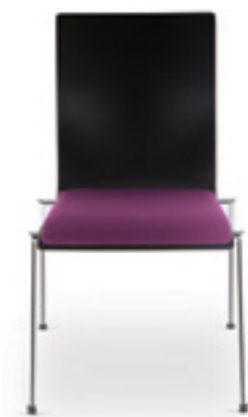
Cadeira S 20