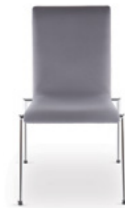
Cadeira S 40