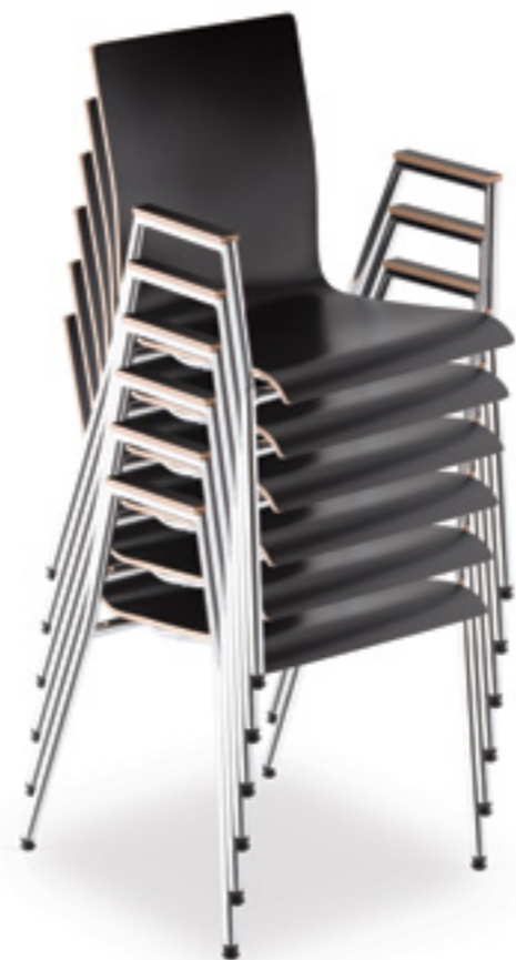
Stacking up to 6 pieces