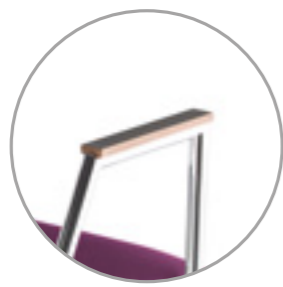
Armrests with wooden pads