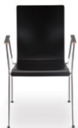
Cadeira HA 10