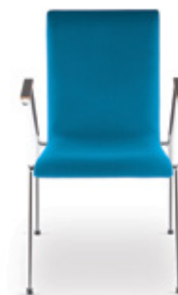
Cadeira SA 40