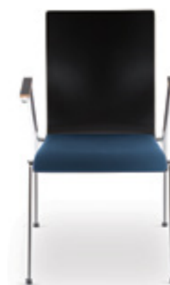
Cadeira SA 20