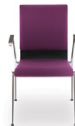
Cadeira SA 30