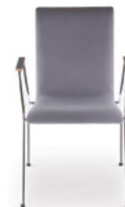
Cadeira HA 40