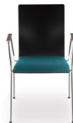
Cadeira HA 20