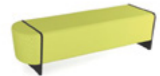
Magnes II 203