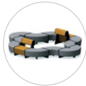
Unlimited configuration possibilities