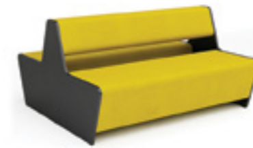
Magnes II 502