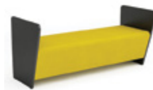
Magnes II 210