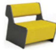
Magnes II 101