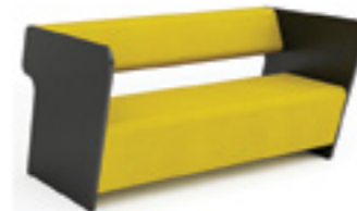
Magnes II 211