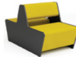
Magnes II 501