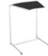
Magnes II 300