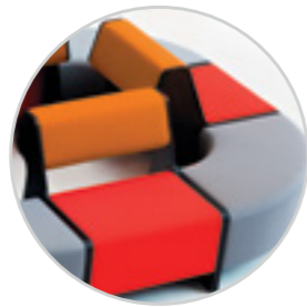
Possibility to upholster the seat and cushion in different colours