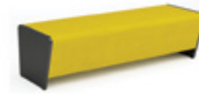
Magnes II 200