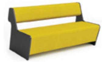
Magnes II 201