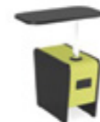
Magnes II 601