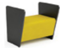
Magnes II 110