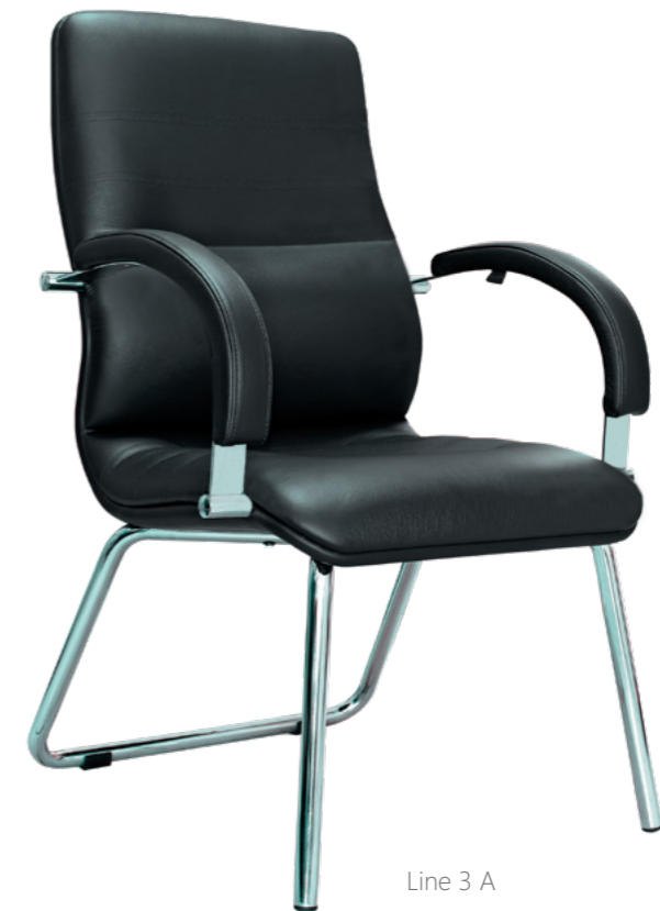
Line 3 A