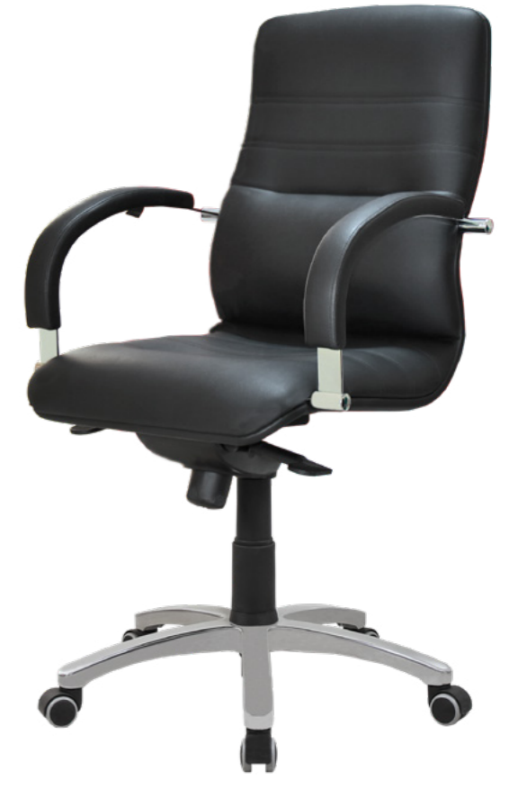
Line 5 A