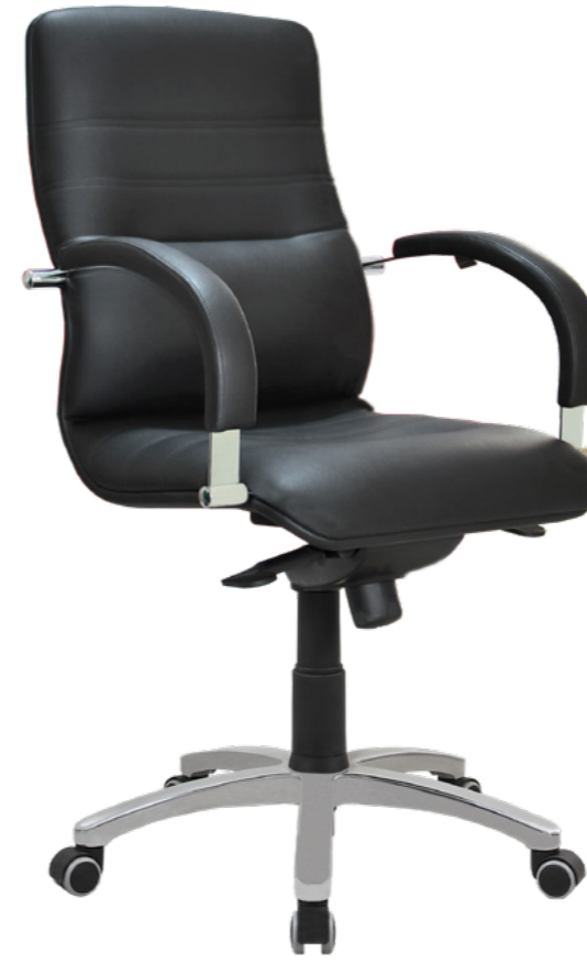
Line 6 A