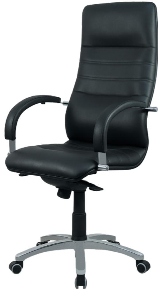
Line 7 A