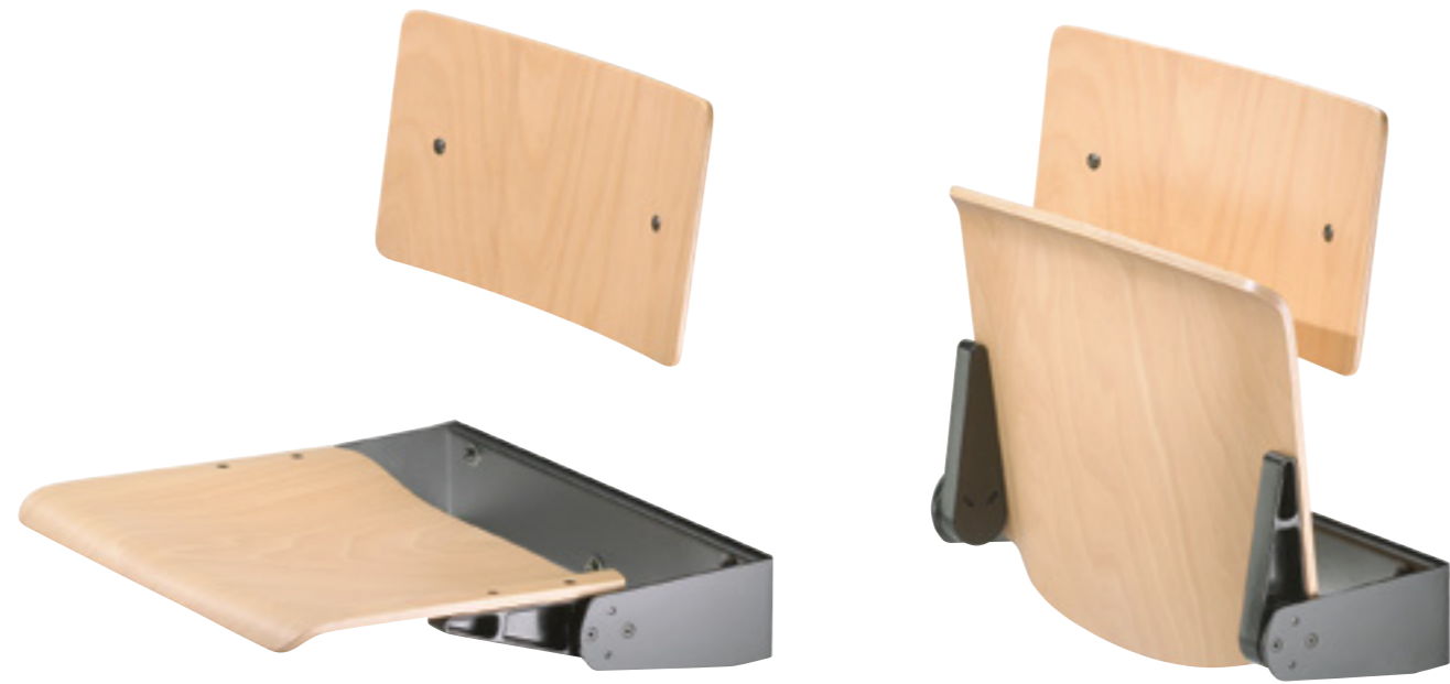
Henry 10 R