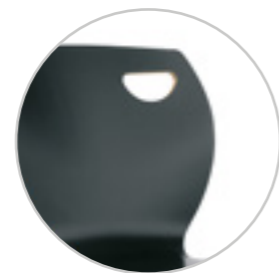
Decorative cut pattern on the backrest