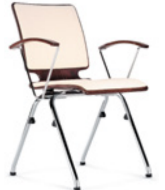
Axo 30 A