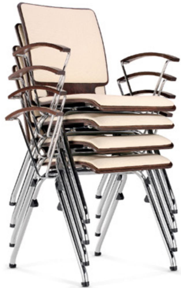
Stacking up to 10 pieces