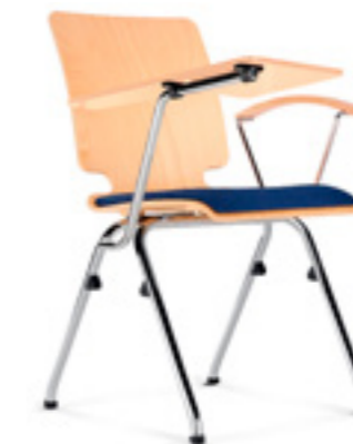
Axo 20 A TB