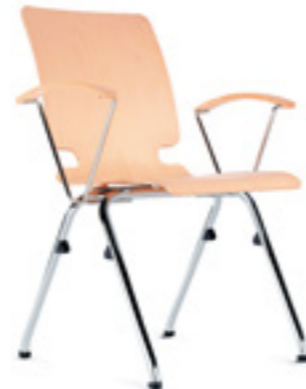
Axo 10 A