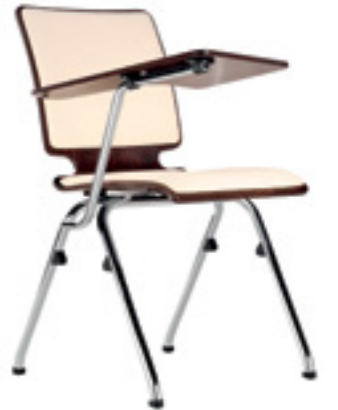
Axo 30 TB