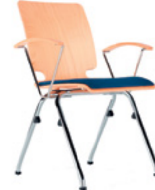
Axo 20 A