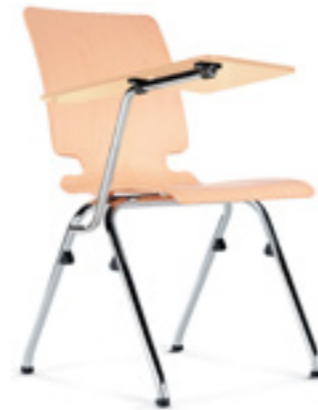
Axo 10 TB