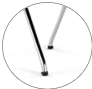
Self-levelling glides for soft and hard floors