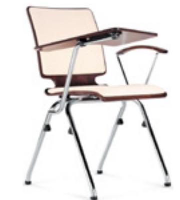
Axo 30 A TB