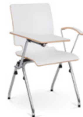
Axo 10 A TB