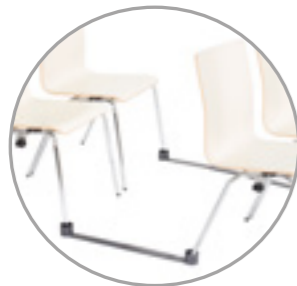
Universal row linking system