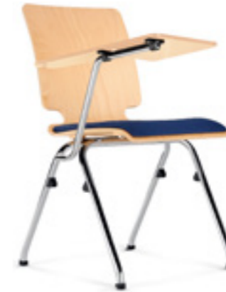
Axo 20 TB