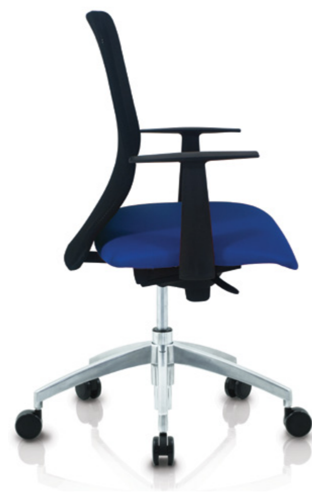
Emo II 18 A