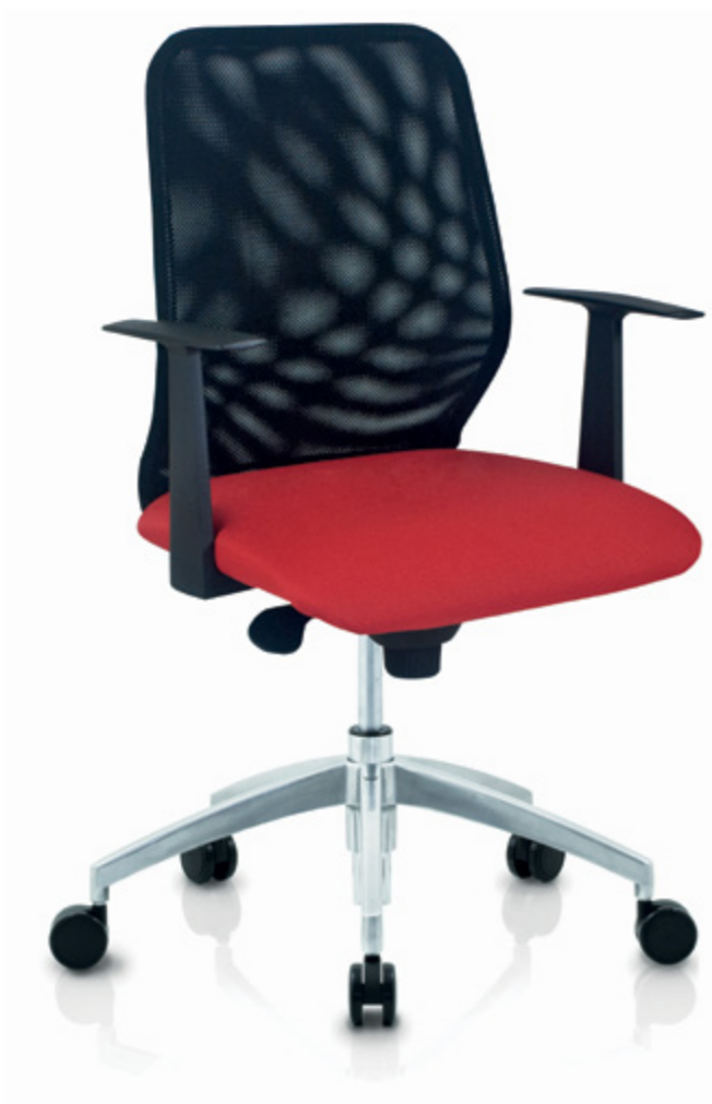
Emo II 20 A