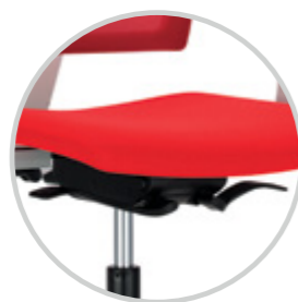
Various mechanism options