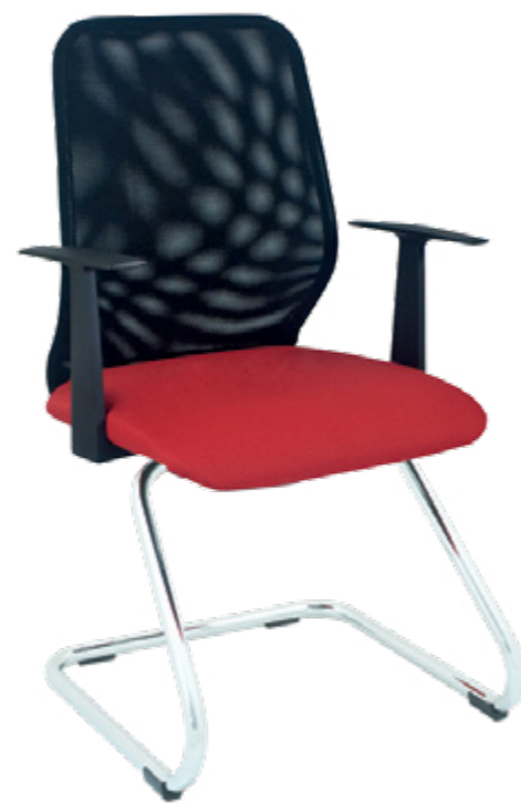
Emo II 3 A