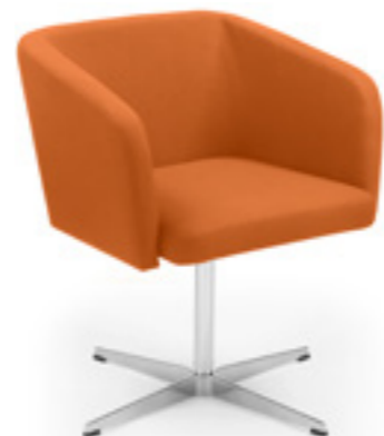
Ciao! HB 42