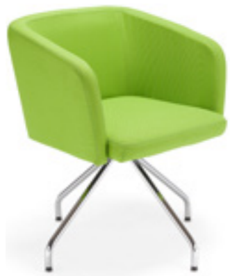
Ciao! HB 38

Mechanism that allows the user to rotate the armchair while sitting