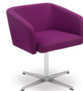
Ciao! LB 42