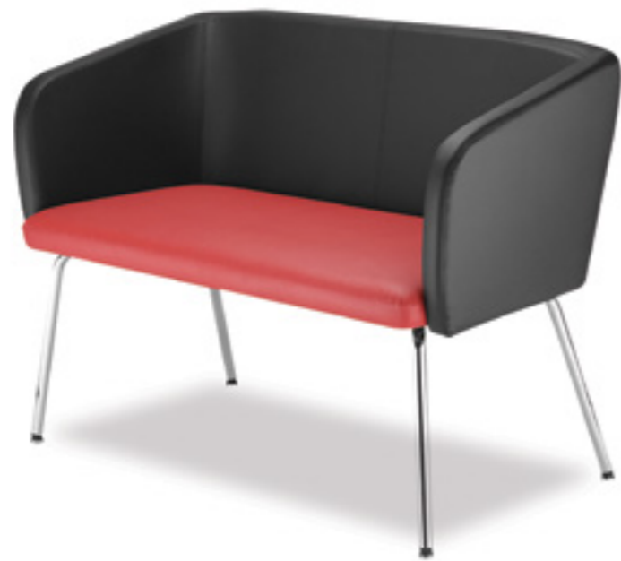
Ciao! HB 40 two-seater