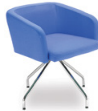
Ciao! LB 38