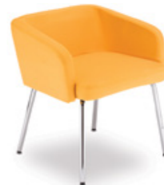
Ciao! LB 40