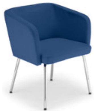
Ciao! HB 40