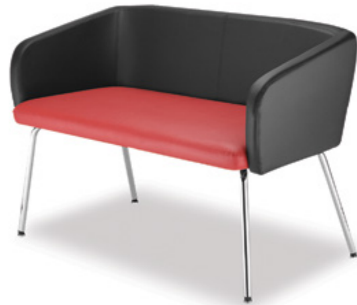
Ciao! LB 40 two-seater